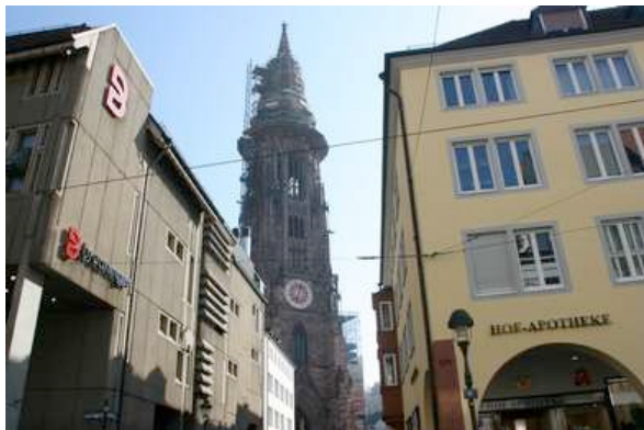
fudder-Redaktion: "Der schönste Turm der Christenheit, unser