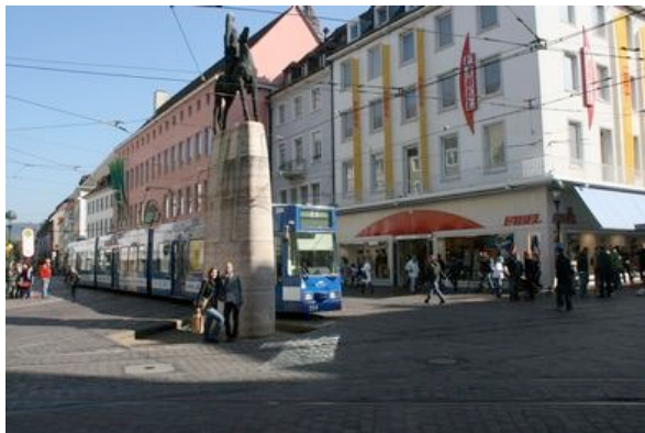
fudder-Redaktion: "Der Bert in der Totalen. Dazu diese tolle Dynamik mit der Straßenbahn. Voll des Freiburg-Feeling."